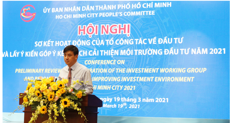
Ông Lê Hòa Bình, Phó Chủ tịch Ủy ban Nhân dân Thành phố phát biểu khai mạc Hội nghị

- Thực hiện thanh tra, kiểm tra theo đúng quy định của pháp luật (không quá một lần/năm); kết hợp thanh tra, kiểm tra liên ngành nhiều nội dung trong một đợt thanh tra, kiểm tra, trừ trường hợp thanh tra,