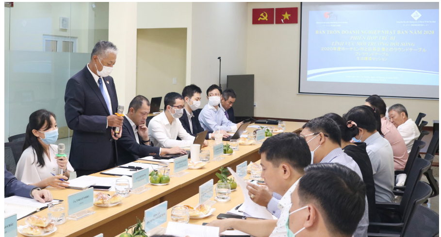
Một hoạt động cụ thể "hỗ trợ doanh nghiệp vượt khó" do ITPC phối hợp với Hiệp hội Doanh nghiệp Nhật Bản (JCCH) tổ chức Phiên trưng bày bán tròn Nhật Bản về lĩnh vực môi trường- đời sống. Đây là hoạt động hướng tới "Kỷ niệm 20 năm Hội nghị bán tròn doanh nghiệp Nhật Bản tại Thành phố Hồ Chí Minh" tổ chức vào ngày 14 tháng 12 năm 2021.

Một là , tiếp tục thực hiện nghiêm các biện pháp phòng, chống dịch bệnh theo chỉ đạo của Ban chỉ đạo Quốc gia phòng chống dịch bệnh. Không chủ quan, lơ là; cách ly có chọn lọc, linh hoạt, thích ứng với trạng thái bình thường mới; nâng cao năng lực xét nghiệm tại các cửa khẩu sân bay, bến cảng cùng với năng lực điều trị bệnh Covid-19, năng lực tiêm chủng tại các cơ sở y tế nhà nước và tư nhân.