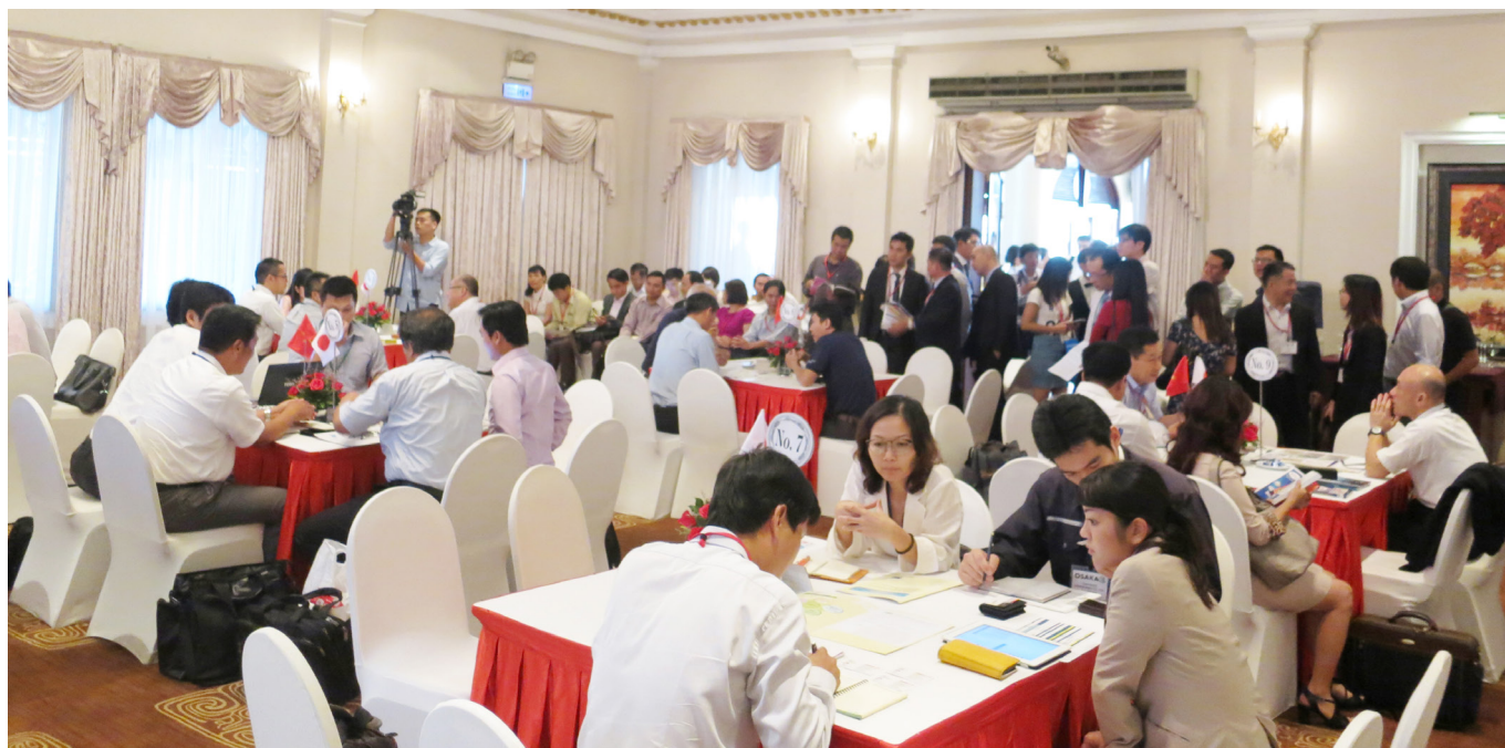
Kết nối B2B Việt Nam với doanh nghiệp vùng Osaka, Nhật Bản tại TP.HCM năm 2015