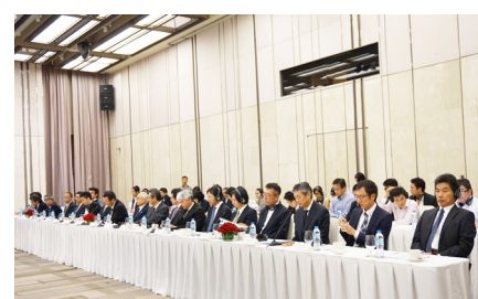
Doanh nghiệp Nhật Bản dự hội nghị Bàn tròn lần thứ 13 năm 2014