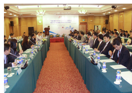
Hội nghị Bàn tròn lần thứ 12 năm 2013