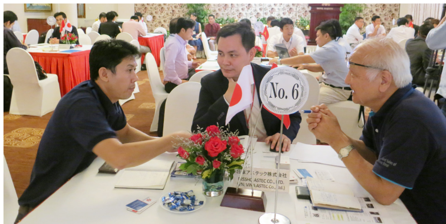
Kết nối B2B Việt Nam với doanh nghiệp vùng Osaka, Nhật Bản tại TP.HCM năm 2015

Hội nghị Bàn tròn Doanh nghiệp Nhật Bản là nơi ghi nhận và giải quyết những vướng mắc, khó khăn, kiến nghị và đề xuất của cộng đồng doanh nghiệp Nhật Bản. Đây là một trong các hoạt động nhằm thực hiện hóa chủ trương cải cách thủ tục hành chính, hoàn thiện môi trường đầu tư của Thành phố, qua đó góp phần tạo thuận lợi cho hoạt động của các nhà đầu tư nước ngoài, trong đó có Nhật Bản.