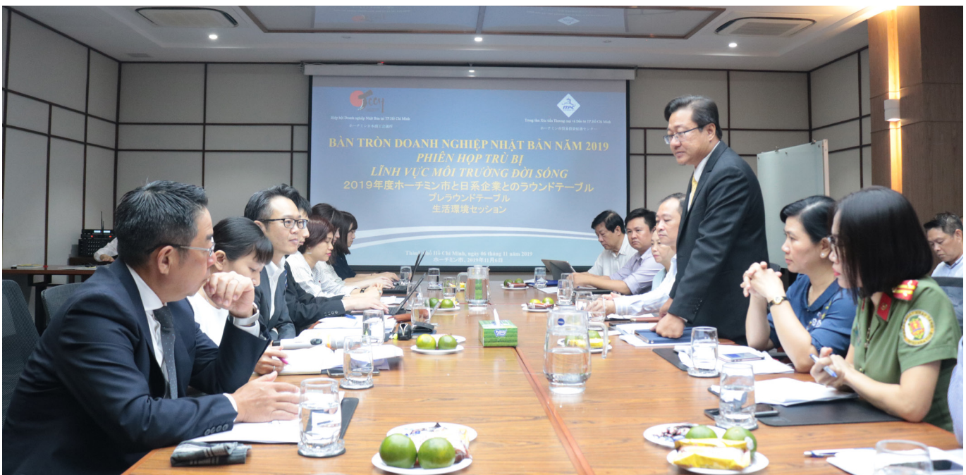
Phiên trữ bị lĩnh vực môi trường đời sống chuẩn bị cho Hội nghị Bàn tròn năm 2019