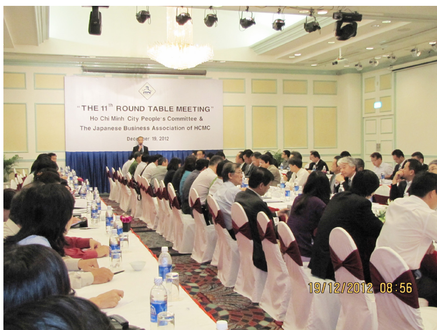
Hội nghị Bàn tròn lần thứ 11 ngày 19.12.2012

Hiệp hội Doanh nghiệp Nhật Bản tại TP.HCM (JCCH) tổ chức. Chào mừng 20 Hội nghị Bàn tròn Doanh nghiệp Nhật Bản tại Thành phố Hồ Chí Minh, Bản tin ITPC xin giới thiệu tư liệu hình ảnh các Hội nghị Bàn tròn và những hoạt động xúc tiến thương mại, đầu tư giữa Việt Nam - Nhật Bản từ năm 2012 đến nay.