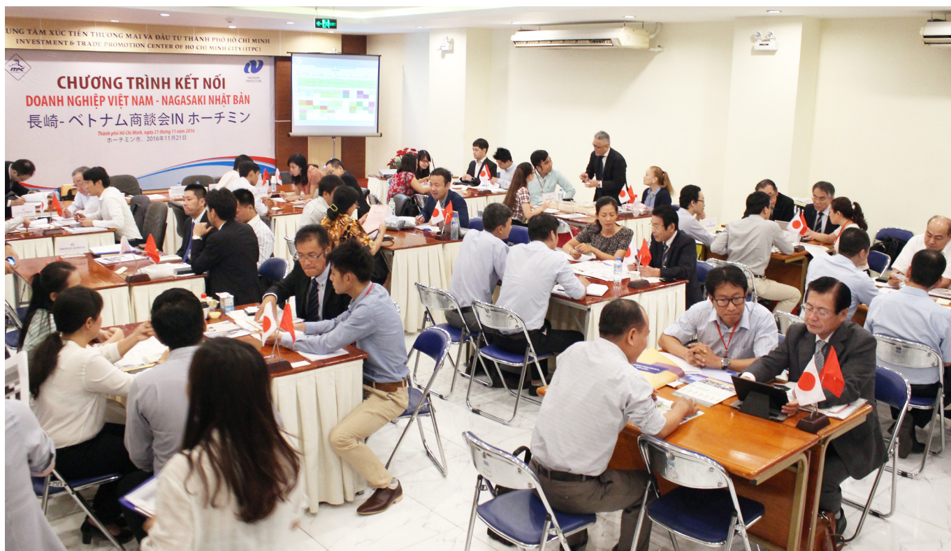
Chương trình kết nối Doanh nghiệp Việt Nam - Nagasaki Nhật Bản vào năm 2016

Để tăng cường thắt chặt hơn nữa mối quan hệ giữa các sở ban ngành và hội viên JCCH, bên cạnh việc đưa ra và giải quyết các kiến nghị, chúng tôi hi vọng sẽ được lắng nghe các kiến nghị từ UBND TP về xúc tiến đầu tư. Không chỉ dừng lại ở việc tổ chức hội thảo, chúng tôi mong muốn sẽ có nhiều hơn nữa các hoạt động hỗ trợ song phương để các doanh nghiệp đồng hành cùng sự phát triển của Thành phố.