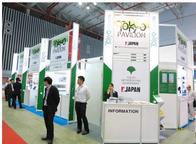
Triển lãm công nghiệp hỗ trợ

trường đời sống, 102 vấn đề liên quan đến lĩnh vực pháp luật - lao động, 86 vấn đề liên quan đến lĩnh vực thuế và 92 vấn đề thuộc lĩnh vực hải quan. Trung bình mỗi kỳ họp, Ban tổ chức nhận và giải quyết 40 vấn đề. Trong đó, năm nhận được nhiều vướng mắc nhất là năm 2013 với 64 vấn đề, năm nhận được ít vướng mắc nhất là năm 2011 với 18 vấn đề.