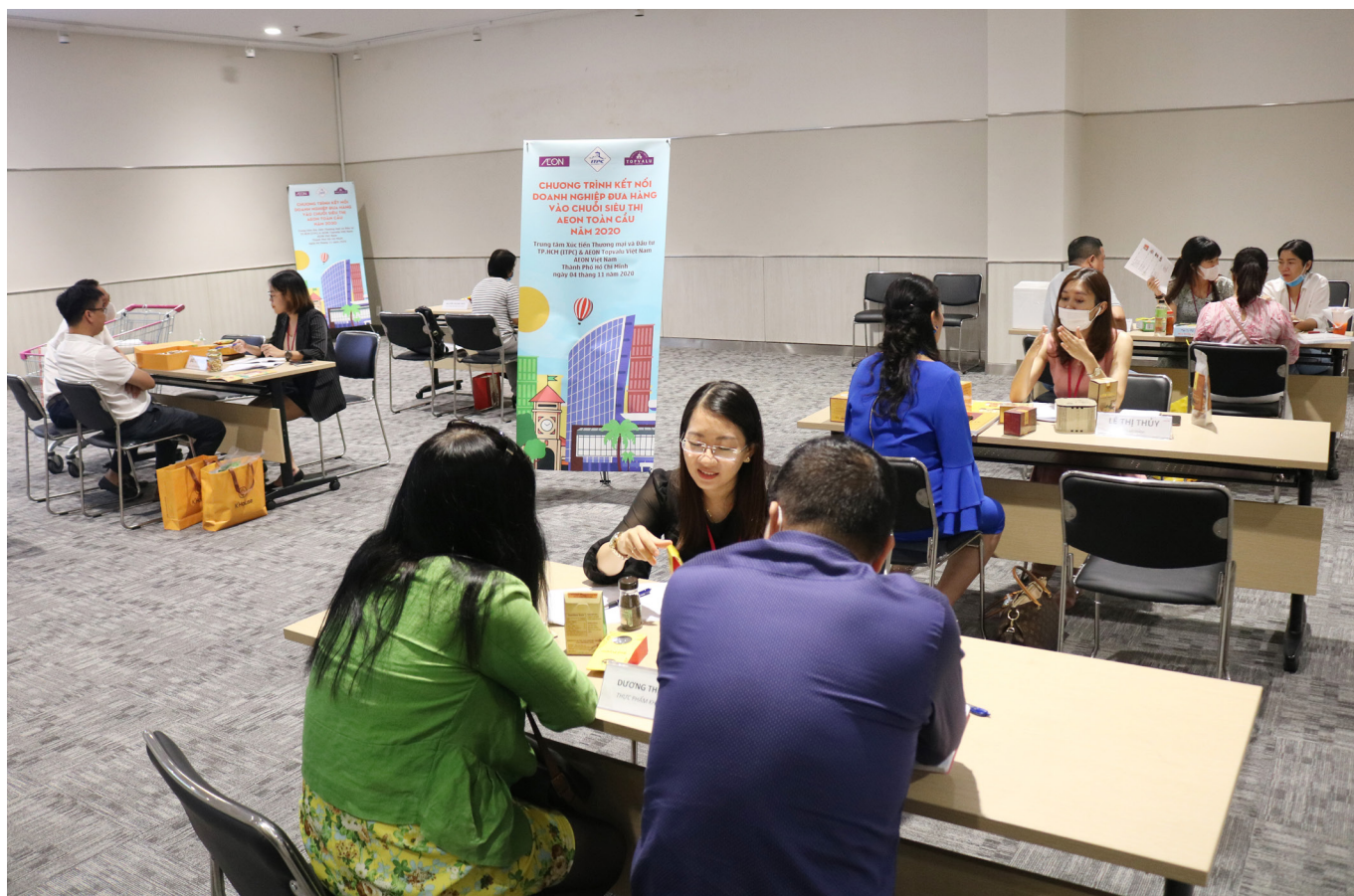
Hoạt động xúc tiến đưa hàng hóa Việt Nam vào kênh phân phối AEON - Nhật Bản năm 2020