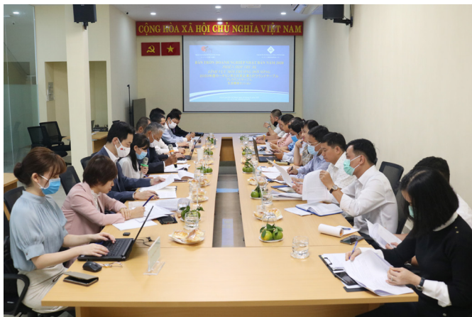
Phiên trụ bị về môi trường đời sống năm 2020