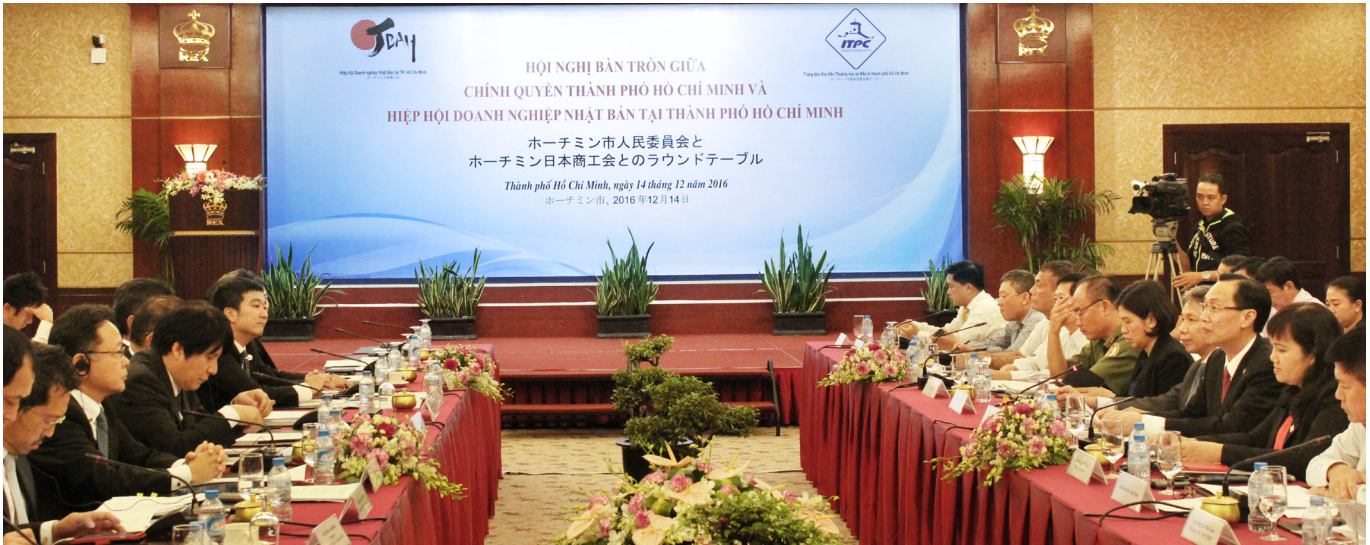
Hội nghị Bàn tròn giữa chính quyền TP.HCM và Doanh nghiệp Nhật Bản năm 2016