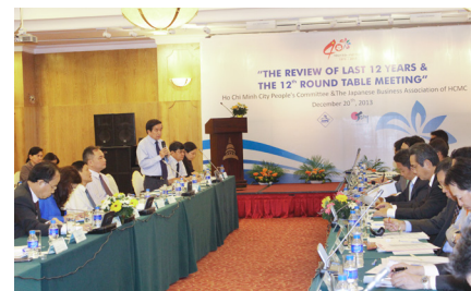
Hội nghị Bàn tròn lần thứ 12 vào năm 2013

Thứ ba là Việt Nam nói chung có nền chính trị ổn định và gần gũi với đất nước Nhật Bản. Vì vậy, số