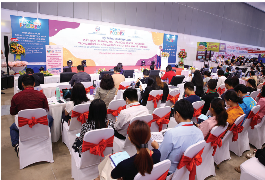
Các doanh nghiệp tham gia buổi Hội thảo.

thông tin tiêu chuẩn chất lượng sản phẩm, tiềm năng thị trường và các bước làm việc với các nhà phân phối quốc tế sao cho đạt hiệu quả. Đồng thời hướng doanh nghiệp theo xu hướng tư duy phát triển sản phẩm, kết hợp với bao bì theo định hướng phát triển bền vững.