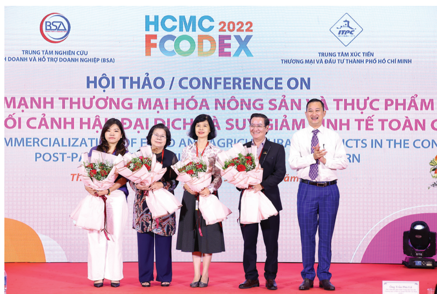
Ban Tổ chức tặng hoa lưu niệm cho các diễn giả tham gia Hội thảo.