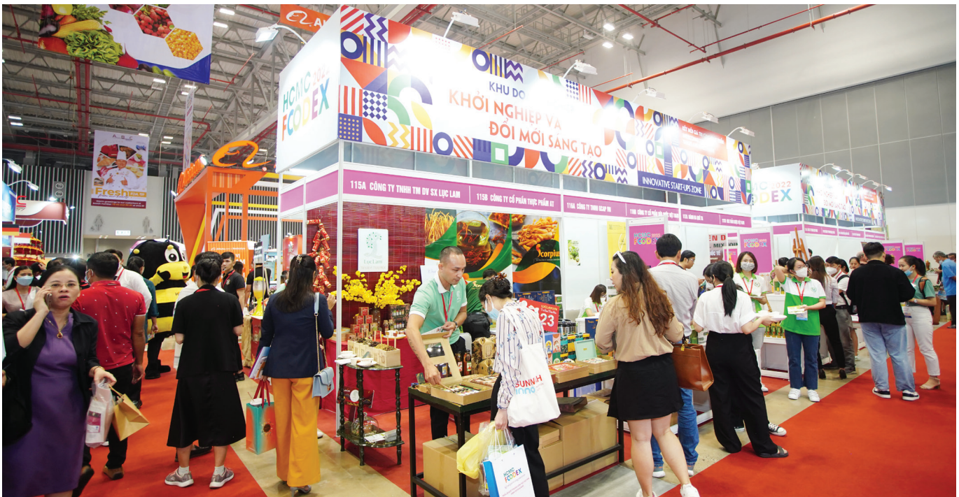
Gián hàng “Khởi nghiệp và đổi mới sáng tạo” giới thiệu nhiều sản phẩm có tính sáng tạo, độc đáo.

Tôi xin chân thành cảm ơn UBND TP. HCM, Trung tâm Xúc tiến Thương mại và Đầu tư TP. HCM đã tổ chức sự kiện vô cùng hữu ích này. Hội LTTP mong rằng sẽ tiếp tục đồng hành và hỗ trợ tổ chức nhiều hơn nữa các chương trình Triển lãm tương tự trong tương lai.