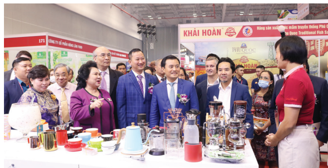
Phó Chủ tịch UBND TP.HCM Bùi Xuân Cường tham quan gian hàng HCM FOODEX 2022.

Trong bối cảnh doanh nghiệp còn nhiều khó khăn, thách thức, lãnh đạo Thành phố mong muốn Trung tâm Xúc tiến Thương mại và Đầu tư (ITPC) phát huy tinh thần năng động, sáng tạo, tiếp tục đổi mới hình thức và nội dung, nâng cao chất lượng và hiệu quả thực hiện các hoạt động xúc tiến thương mại đáp ứng nhu cầu của doanh nghiệp, hỗ trợ doanh nghiệp quảng bá sản phẩm, kết nối với các hệ thống phân phối, người mua trong nước và quốc tế, tìm đầu ra tiêu thụ