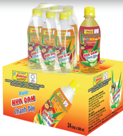
Nha đam chanh dây 360ml