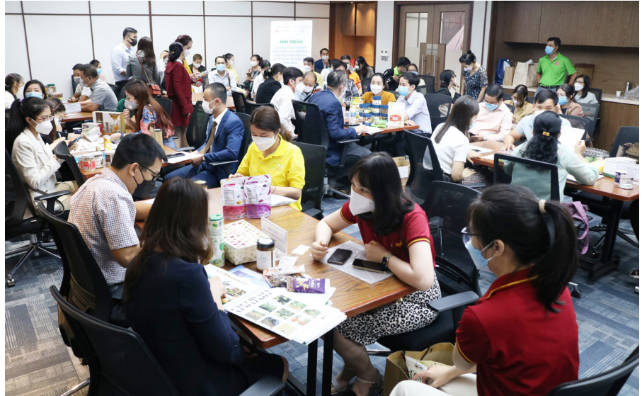
Toàn cảnh buổi kết nối.

Thiết, Hà Nội, Vũng Tàu, Cần Thơ, Nha Trang và trở thành điểm đến được lựa chọn của hơn 20 triệu lượt khách hàng mỗi năm cho cuộc sống hiện đại. Trong suốt thời gian kể từ khi đại dịch Covid-19 bùng phát, Lotte Mart không ngừng áp dụng nhiều biện pháp phòng dịch tối ưu để tạo môi trường mua sắm an toàn cho khách hàng.