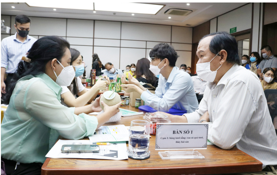
Doanh nghiệp tham gia vào buổi kết nối do ITPC tổ chức

Để bắt đầu các hoạt động kết nối năm 2022, Trung tâm Xúc tiến Thương mại và Đầu tư Thành phố (ITPC) đã phối hợp Công ty CP Trung tâm Thương mại Lotte Việt Nam tổ chức Hội thảo “Chương trình kết nối đưa hàng hóa Việt Nam vào hệ thống siêu thị Lotte Mart tại Việt Nam năm 2022” nhằm giới thiệu về hoạt động của chuỗi hệ thống siêu thị Lotte Mart, những tiêu chuẩn kỹ thuật để đưa hàng vào siêu thị Lotte Mart Việt Nam cũng như hướng dẫn các sản phẩm OCOP của doanh nghiệp Việt vào chuỗi siêu thị này, cung cấp thông tin về xu hướng ứng dụng công nghệ mới trong đóng gói từ đại diện Công ty CP trung tâm Thương mại Lotte Việt Nam. Từ đó, doanh nghiệp nắm bắt tốt hơn nhu cầu