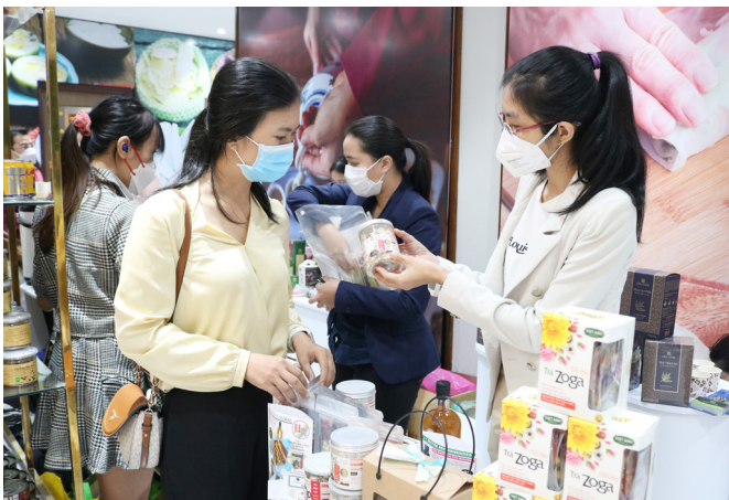
Khách hàng tham quan gian hàng triển lãm tại hội thảo

Lotte Mart có hệ thống 14 siêu thị ở Thành phố Hồ Chí Minh, Đồng Nai, Đà Nẵng, Bình Dương, Phan