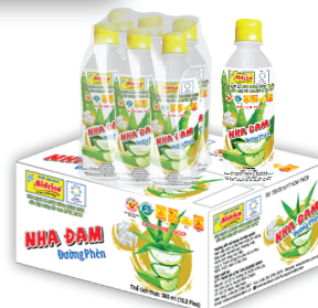
Nha đam đường phèn 360ml