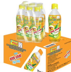
Nha đam mật ong 360ml

– Nước uống Nha Đam Đường Phèn, Nha đam Mật Ong, Nha đam Chanh dây, Nha đam hương Bắp Bidrico được chiết xuất từ nha đam nguyên chất kết hợp với đường phèn, mật ong, chanh dây, hương bắp... tạo nên một thức uống thơm ngon, bổ dưỡng và thanh mát.