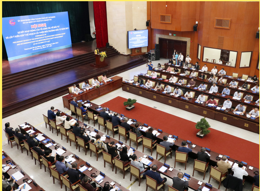
(Theo trang thanhuytphcm.vn) - Phòng Thông tin - ITPC

Dự kiến trong thời gian tới, theo sự chỉ đạo của UBND TPHCM, ITPC sẽ phối hợp với Sở kế hoạch đầu tư, Sở quy hoạch kiến trúc, Ban Quản lý khu đô thị Tây Bắc, các Ủy ban nhân dân huyện Hóc Môn, Củ Chi và một số đơn vị liên quan tổ chức Hội nghị Xúc tiến đầu tư vào Hóc Môn và Củ Chi . ITPC đã tổ chức thành công nhiều hội nghị quan trọng cho TPHCM. Trong ảnh là Hội nghị “Sơ kết hoạt động của Tổ công tác về đầu tư và lấy ý kiến góp ý kế hoạch cải thiện môi trường đầu tư của TPHCM năm 2021” tháng 3.2021.