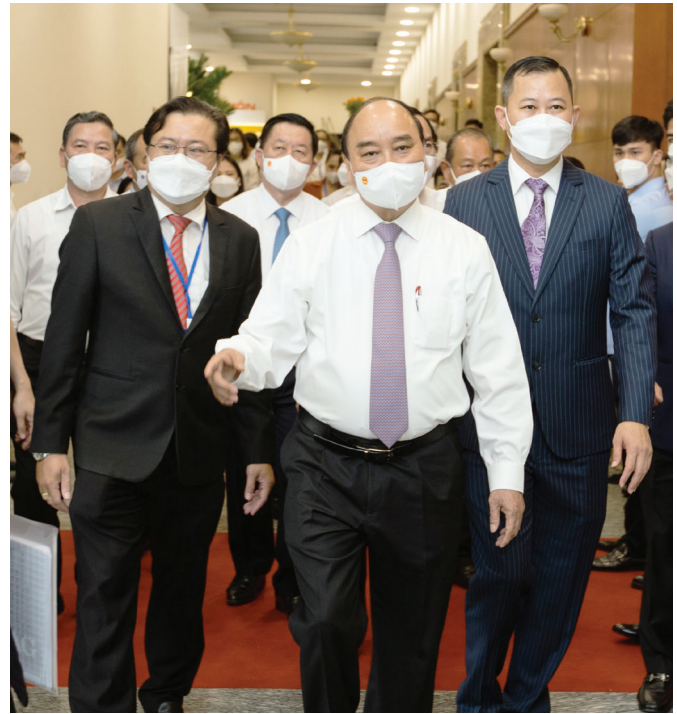
Tham dự Hội nghị Xúc tiến vào Hóc Môn và Củ Chi, Chủ tịch nước Nguyễn Xuân Phúc đề nghị TPHCM cải thiện môi trường đầu tư.

Trước các cam kết đầu tư khoảng 17 tỷ USD, trong đó có gần 500 triệu được cấp phép đầu tư, không chỉ kinh tế công nghiệp, du lịch, dịch vụ, nông nghiệp công nghệ cao, TP sinh thái, môi trường mà còn quan tâm đến xử lý rác, nhà ở xã hội. Do đó, Chủ tịch Nguyễn Xuân Phúc yêu cầu TP thực hiện quy hoạch phải phù hợp với quy hoạch được phê duyệt. “Nếu quy hoạch có thay đổi thì phải xem xét tiếp thu các chuyên gia, nhà chuyên môn, và được điều chỉnh, bổ sung minh bạch, phù hợp quy định của luật pháp, được cấp có thẩm quyền phê duyệt.” - Chủ tịch Nguyễn Xuân Phúc lưu ý.