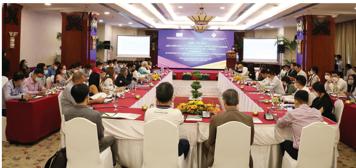
Toàn cảnh Hội nghị Xúc tiến Đầu tư vào đặc khu Mariel, Cuba.