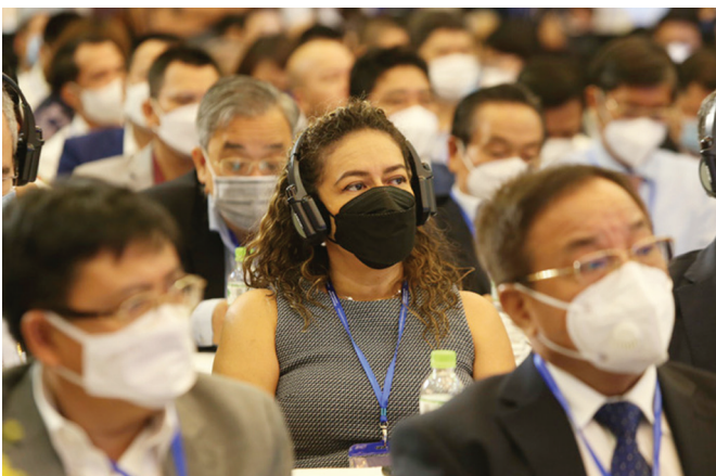
Rất đông doanh nghiệp trong và ngoài nước tham dự Diễn đàn