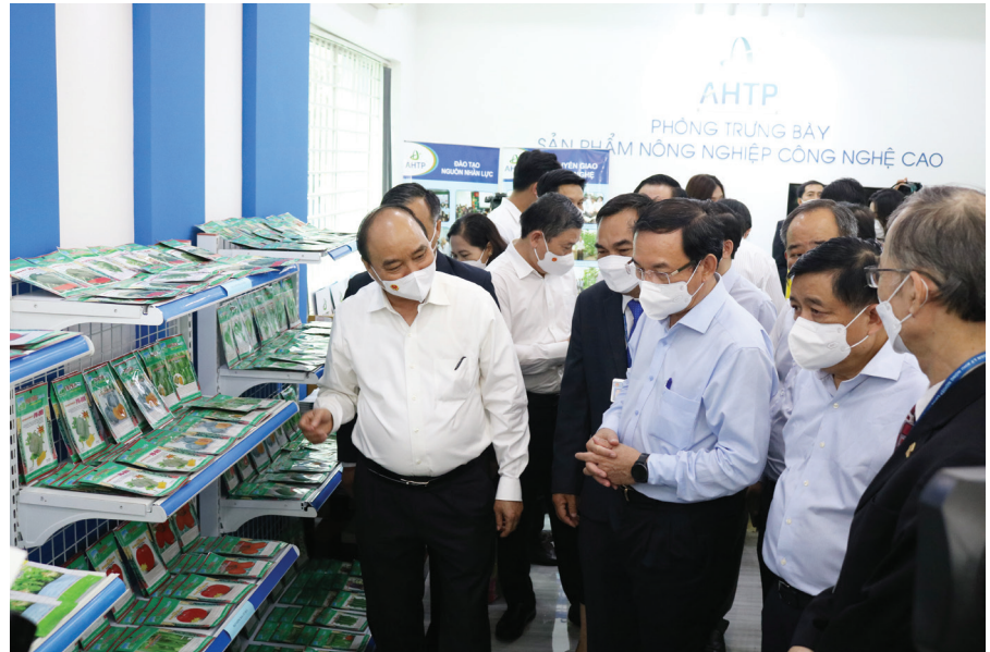
State President Nguyen Xuan Phuc pays a visit to HCM City Agricultural High-tech Park.

According to President Nguyen Xuan Phuc, Ho Chi Minh City needs to solve the problem of expanding