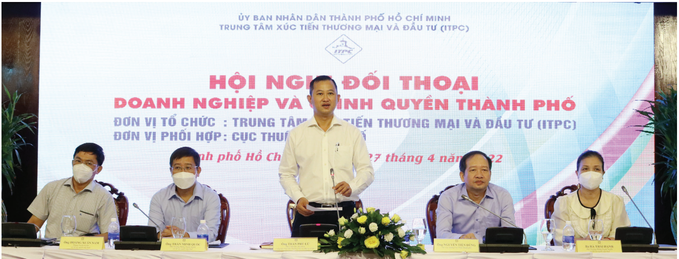
Lãnh đạo ITPC và Cục Thuế TP.HCM tham gia Hội nghị đối thoại với Doanh nghiệp ngày 27.4.2022.

Sáng ngày 27 tháng 4 năm 2022, Trung tâm Xúc tiến Thương mại và Đầu tư TP.HCM (ITPC) đã phối hợp với Cục Thuế Thành phố tổ chức Hội nghị Đối thoại Doanh nghiệp - Chính quyền Thành phố. Hội nghị nhằm giải đáp câu hỏi vướng mắc, tháo gỡ khó khăn của cộng đồng doanh nghiệp Thành phố liên quan đến Hóa đơn điện tử, Nghị định số 15/2022/