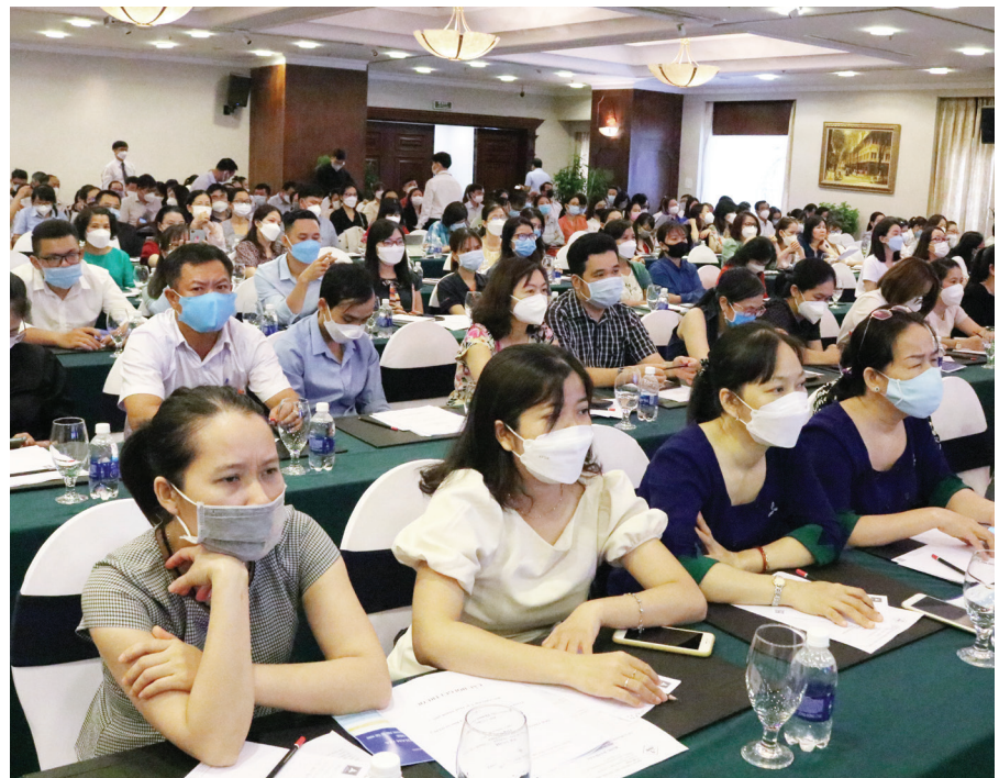
200 doanh nghiệp đăng ký tham dự Đối thoại với Cục Thuế.