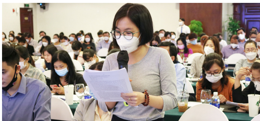
Ảnh trong trang: Các doanh nghiệp nêu nhiều câu hỏi trực tiếp tại Hội nghị.