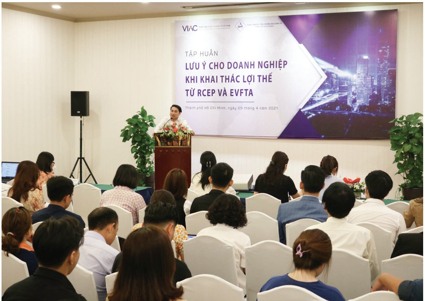
ITPC tổ chức Tập huấn "Lưu ý cho doanh nghiệp khi khai thác lợi thế từ RCEP và EVFTA" diễn ra ngày 09/04/2021.

Các nước thành viên RCEP đều sẽ chứng kiến xuất - nhập khẩu tăng, trong đó Việt Nam dự kiến đạt mức tăng xuất khẩu cao nhất với 11,4%, đặc biệt là xuất khẩu thiết bị điện, máy móc, hàng dệt và quần áo.