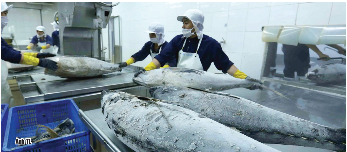
(Nguồn: Báo Công Thương) - VEXA - ITPC

Hiện có tất cả 18 công ty của Việt Nam tham gia xuất khẩu cá ngừ sang thị trường Đức. Trong đó, 3 công ty XK lớn nhất, gồm: Bidifisco, FoodTech và KTCFood với tỷ trọng lần lượt là 34%, 22% và 19%.