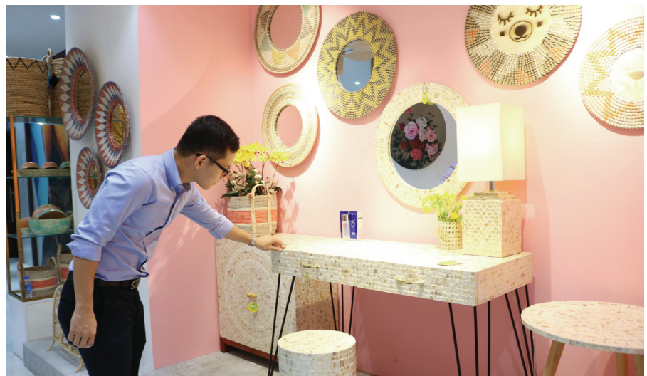
Nhiều góc trưng bày tại sự kiện gây ấn tượng mạnh với người xem

Sau thành công của Chương trình “Tuần lễ triển lãm sản phẩm thủ công mỹ nghệ và đồ gỗ nội thất năm 2022”, Trung tâm Xúc tiến Thương