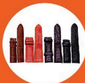
DÂY ĐỒNG HỒ