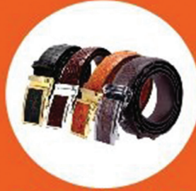
DÂY THẮT LƯNG