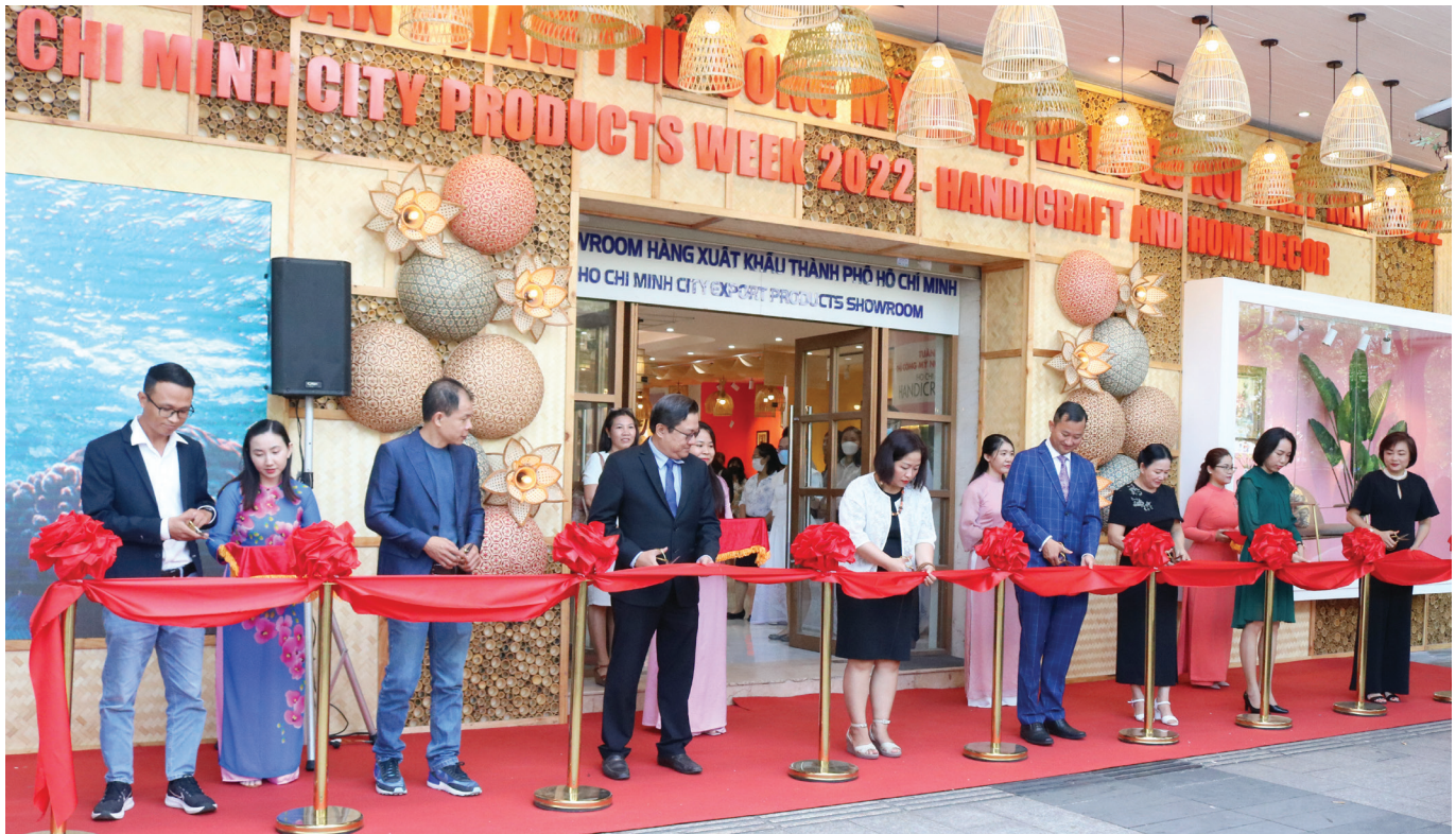
Các đại biểu cắt băng khai mạc sự kiện

nguồn nguyên liệu trong nước ổn định và bền vững; tập trung đổi mới công nghệ thiết bị sản xuất và đào tạo nâng cao tay nghề cho các nghệ nhân; nâng cao năng lực thiết kế và quản trị chất lượng sản phẩm; quan tâm tiêu chí về môi trường, điều kiện làm việc cho người lao động.