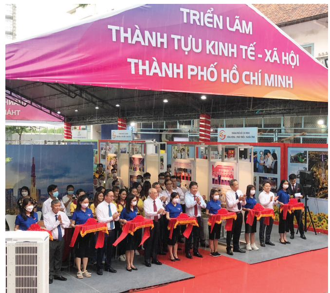
Các đại biểu cắt băng khai mạc buổi Triển lãm

Triển lãm lần này nằm trong khuôn khổ Liên hoan Phát thanh toàn quốc lần thứ XV năm 2022 diễn ra từ ngày 01 tháng 8 đến ngày 06 tháng 8 năm 2022 tại Đài Tiếng nói Nhân dân Thành phố Hồ Chí Minh, số 3 Nguyễn Đình Chiểu, phường Đa Kao, Quận 1, Thành phố Hồ Chí Minh.