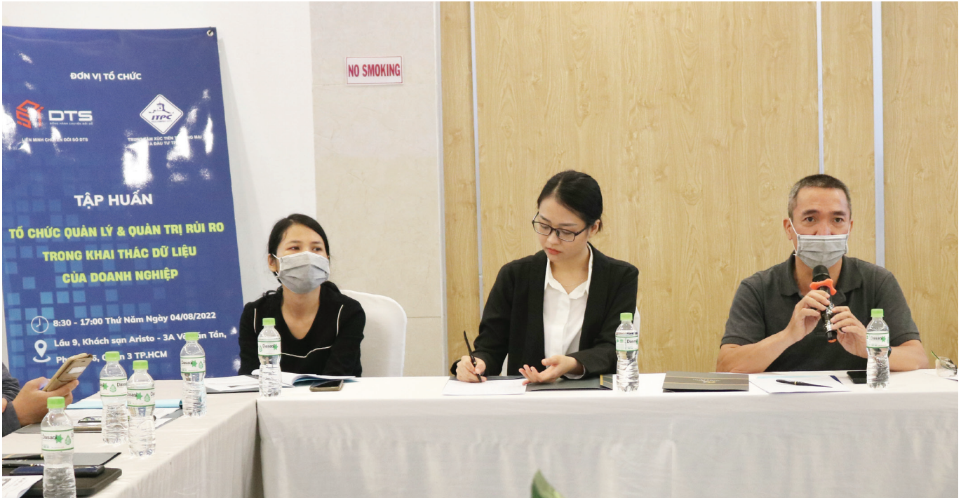
Đại diện các doanh nghiệp đặt câu hỏi với các chuyên gia tại buổi tập huấn