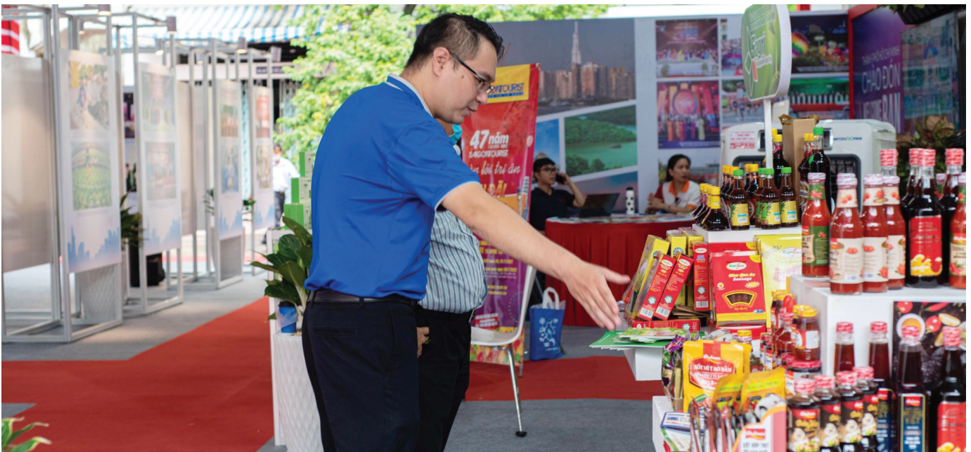
Các sản phẩm của TP.HCM được chọn lọc trưng bày trong buổi Triển lãm