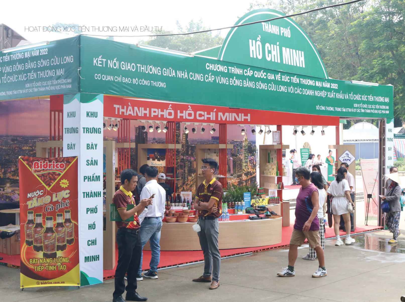
Gian hàng "Thành phố Hồ Chí Minh" do ITPC tham gia thiết kế - tổ chức tại "Chương trình Kết nối giao thương giữa nhà cung cấp vùng Đồng bằng sông Cửu Long với các doanh nghiệp xuất khẩu và tổ chức xúc tiến thương mại".