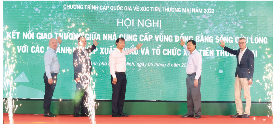
Các lãnh đạo thực hiện nghi thức khai mạc “Chương trình Kết nối giao thương giữa nhà cung cấp vùng Đồng bằng sông Cửu Long với các doanh nghiệp xuất khẩu và tổ chức xúc tiến thương mại”.

Để góp phần tháo gỡ khó khăn cho các nhà sản xuất trong bối cảnh thị trường tiêu thụ vẫn còn khó khăn do ảnh hưởng của dịch bệnh và căng thẳng về chính trị trên thế giới hiện nay, Bộ Công Thương đã, đang và sẽ tiếp tục đồng hành cùng các địa phương trên cả nước nói chung, các tỉnh, thành phố khu vực phía Nam nói riêng, để giới thiệu các sản phẩm tiêu biểu, các sản phẩm có tiềm năng xuất khẩu tới các cơ quan xúc tiến thương mại quốc tế, các nhà nhập khẩu, các nhà thu mua chế biến xuất khẩu Việt Nam cũng như các nhà phân phối Việt Nam, quốc tế. Ngoài ra, Hội nghị cũng sẽ cung cấp thông tin, giải pháp giúp các doanh nghiệp đẩy mạnh xuất khẩu hàng hóa trực tiếp vào các mạng lưới phân phối