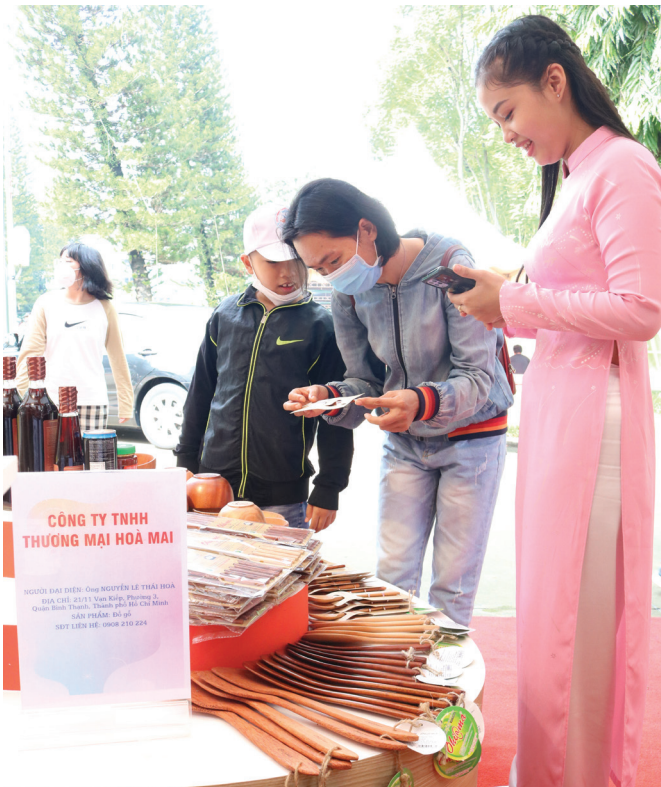
Khách tham quan cụm gian hàng TP.HCM

Hội nghị góp phần tạo điều kiện cho các doanh nghiệp, cơ sở sản xuất, phân phối của TP.HCM và các tỉnh, thành phố gặp gỡ, chia sẻ kinh nghiệm, tìm hiểu thông tin thị trường; thúc đẩy sản xuất, kết nối cung cầu, phát triển hệ thống phân phối hàng hóa phục vụ nhu cầu người tiêu dùng tại các địa phương. Đồng thời, đẩy mạnh công tác truyền thông, quảng bá các sản phẩm thế mạnh, sản phẩm an toàn đảm bảo nguồn gốc, xuất xứ của các tỉnh, thành phố trong cả nước.