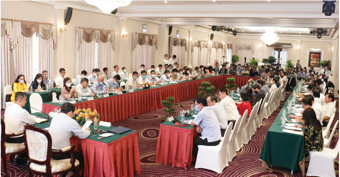
Hệ thống Đối thoại Doanh nghiệp - Chính quyền Thành phố do ITPC tổ chức là hoạt động thiết thực góp phần thúc đẩy cải cách hành chính phục vụ doanh nghiệp. Trong ảnh là Hội nghị đối thoại trực tiếp lần thứ 225 của Hệ thống Đối thoại Doanh nghiệp - Chính quyền Thành phố do ITPC phối hợp Sở Tài nguyên và Môi trường tổ chức ngày 09/8/2022 vừa qua.