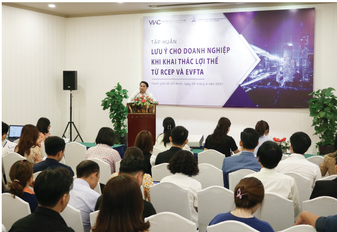
Lớp Tập huấn doanh nghiệp do ITPC tổ chức với chủ đề "Lưu ý cho doanh nghiệp khi khai thác lợi thế từ RCEP và EVFTA"

“RCEP vượt xa các hiệp định thương mại tự do ASEAN hiện nay về mặt cơ hội đầu tư. Trước khi có hiệp định này, Trung Quốc, Hàn Quốc và Nhật đã là những nhà đầu tư hàng đầu tại một số nền kinh tế ASEAN. Tuy nhiên, mở rộng các thị trường ASEAN hơn nữa sẽ thu hút thêm đầu tư vào công nghệ sản xuất mới, giúp thúc đẩy năng suất lao động hơn”, nhóm nghiên cứu HSBC nhấn mạnh.