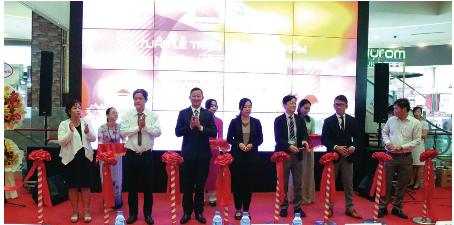
Các đại biểu cắt băng khai mạc “Tuần lễ Triển lãm sản phẩm Doanh nghiệp Việt tại Aeon 2022”