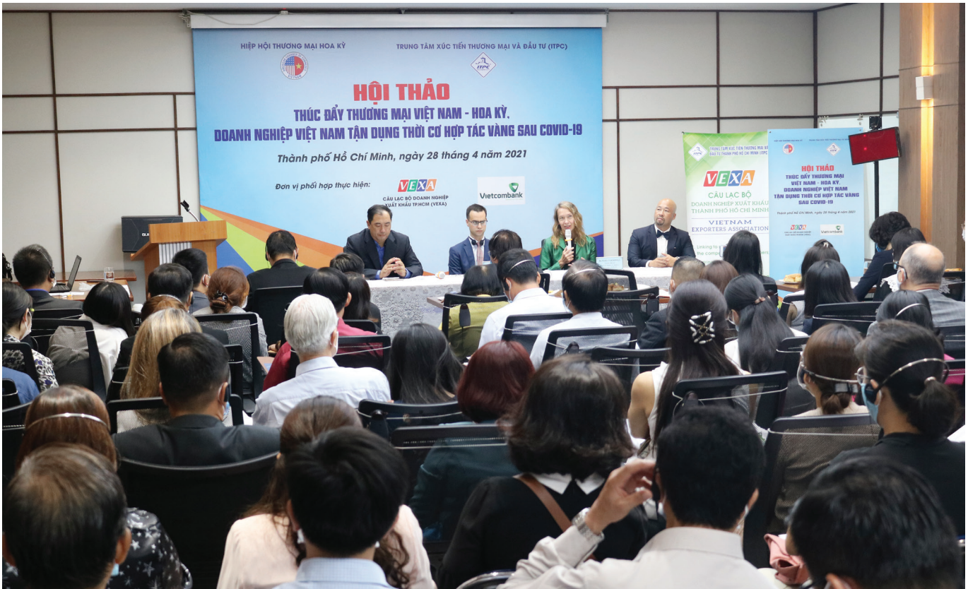
Hội Thảo "Thúc đẩy thương mại Việt Nam - Hoa Kỳ, doanh nghiệp Việt Nam tận dụng thời cơ hợp tác vàng sau Covid-19" do ITPC tổ chức.