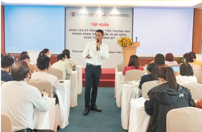
Tập huấn “Nâng cao kỹ năng xúc tiến thương mại ngành hàng thực phẩm và đồ uống sang thị trường Mỹ” do ITPC tổ chức.