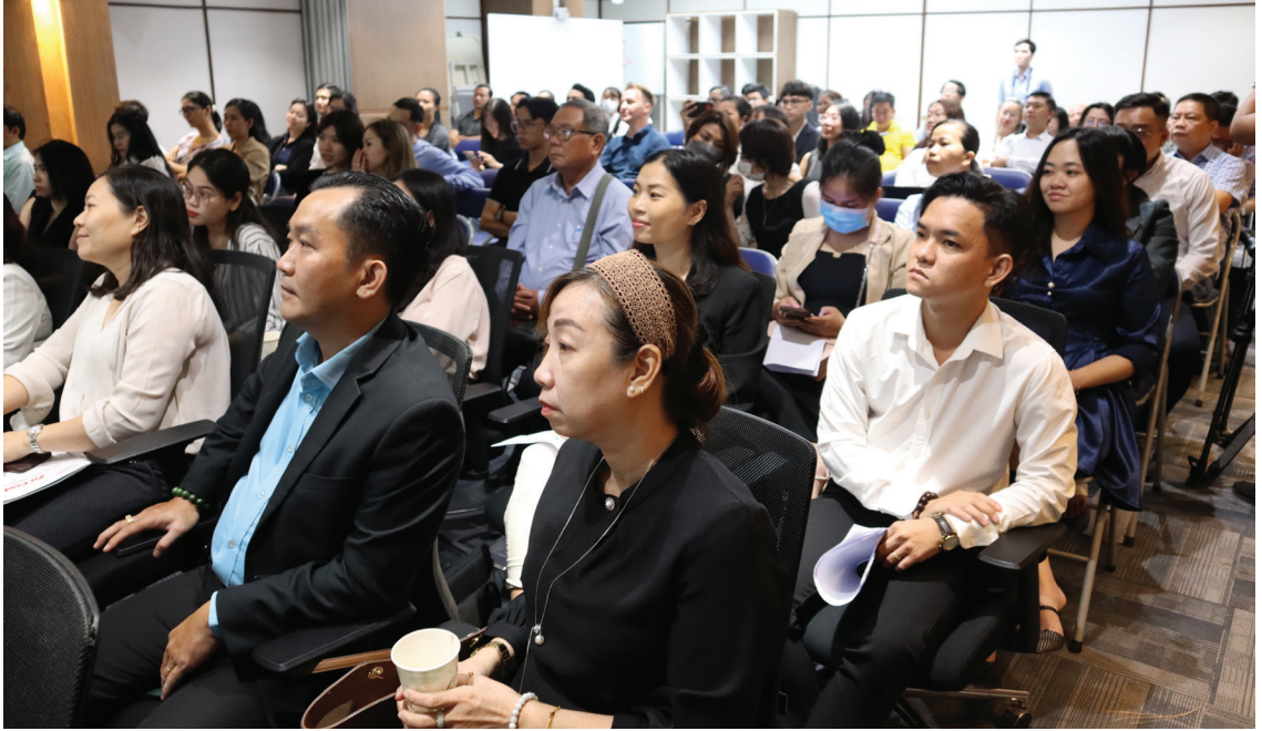
Toàn cảnh buổi Hội thảo.

năm 2022, tổng kim ngạch xuất nhập khẩu giữa Thành phố Hồ Chí Minh và Mexico đạt trên 364 triệu USD, trong đó Thành phố Hồ Chí Minh xuất khẩu sang Mexico trên 300 triệu USD (xuất siêu) tăng 6% so với năm 2022, kim ngạch nhập khẩu từ Mexico đạt 64 triệu USD. Bên cạnh