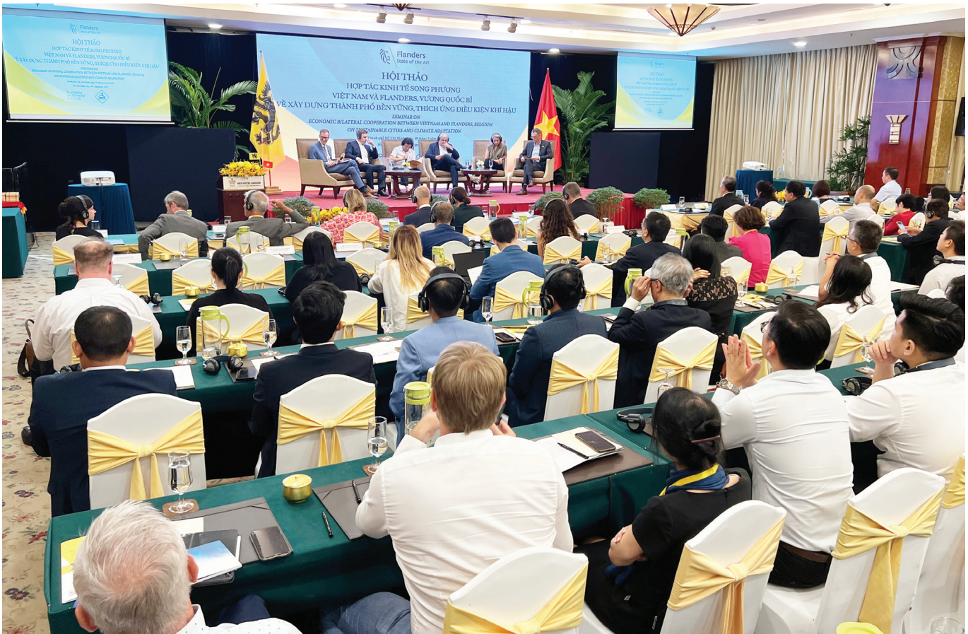
Hội thảo đã thu hút đông đảo đại biểu, đại diện các doanh nghiệp tham gia.

đại diện các đơn vị sở - ban, ngành Thành phố cùng hơn 130 đại diện các doanh nghiệp.