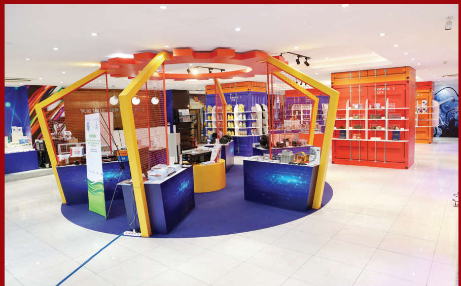
Tuần lễ kết nối giao thương và giới thiệu sản phẩm ngành cơ khí, công nghệ số, điện và điện tử năm 2024

Liên hệ: Phòng dịch vụ - ITPC Điện thoại: (028) 39104903 (028) 39104039 (028) 38222 983 (028) 39104947 Email: bizcenter@itpc.gov.vn; Website: www.itpc.hochiminhcity.gov.vn vexa.vn