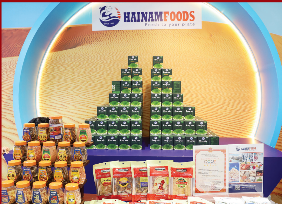
Tuần lễ triển lãm sản phẩm đặc trưng, sản phẩm OCOP tỉnh Bình Thuận năm 2024

ĐIỂM ĐẾN của doanh nhân, doanh nghiệp - nơi tổ chức chuyên nghiệp, hiệu quả các sự kiện xúc tiến thương mại và đầu tư.