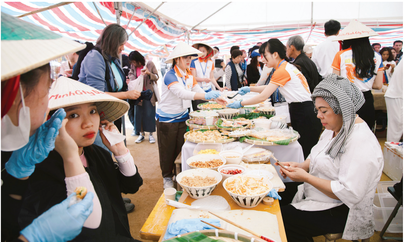
Biểu diễn ẩm thực bánh dân gian trong sự kiện Ngày TP.Hồ Chí Minh tại Osaka, Nhật Bản.

Thành phố Hồ Chí Minh phải cam kết và khẳng định việc tích cực, chủ động tham gia vào quá trình hội nhập kinh tế quốc tế, đẩy mạnh chuyển đổi số, phát triển kinh tế xanh, kinh tế tuần hoàn; tiếp tục thực hiện đồng bộ nhiều giải pháp để hỗ trợ tháo gỡ khó khăn, vướng mắc cho doanh nghiệp, nhà đầu tư, giúp doanh nghiệp sớm phục hồi và phát triển sản xuất kinh doanh sau đại dịch COVID-19; tích cực giải quyết những điểm “nghẽn” đối với sự phát triển bền vững của Thành phố như là tập trung đáp ứng ngày càng tốt hơn các yêu cầu về hạ tầng