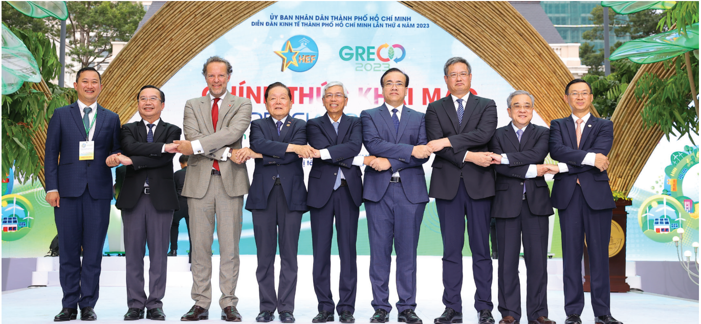
Lễ khai mạc Không gian triển lãm sản phẩm dịch vụ tăng trưởng xanh (Greco 2023) do ITPC tổ chức nằm trong Diễn đàn Kinh tế TP. Hồ Chí Minh lần thứ 4 năm 2023 (HEF 2023) với chủ đề “Tăng trưởng xanh – Hành trình hướng tới giảm phát thải ròng bằng không”.