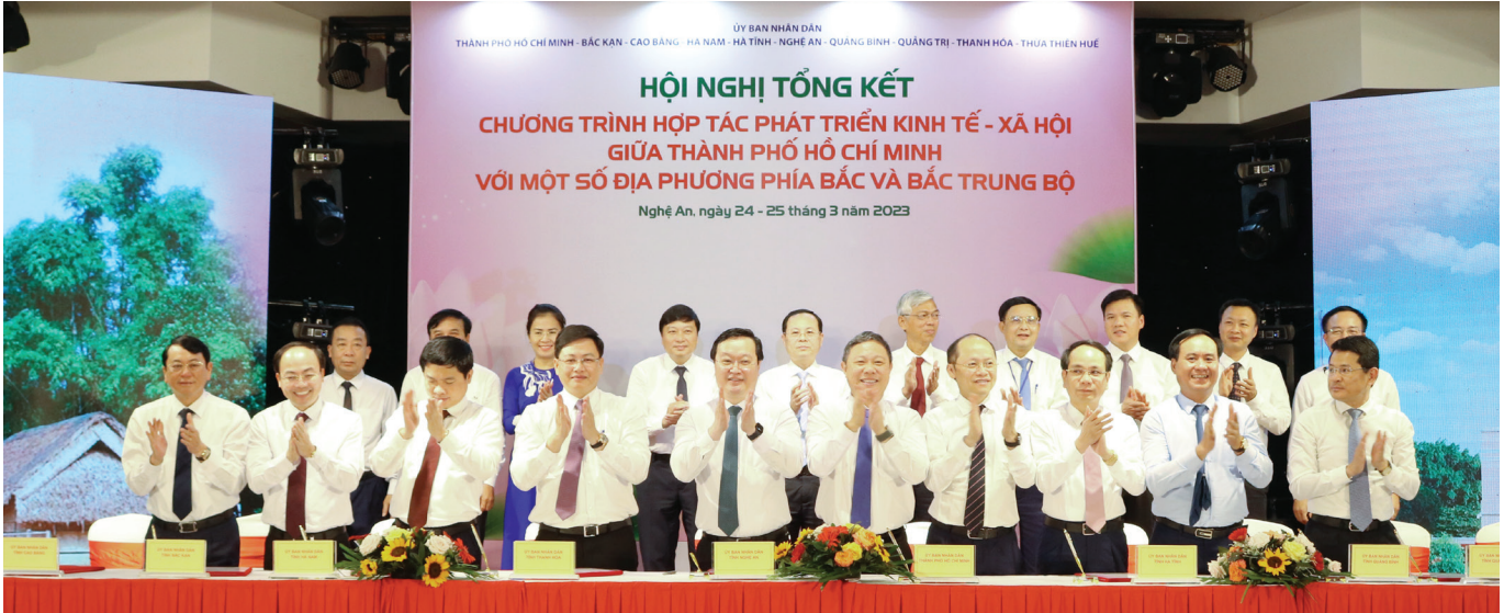
Trong ảnh là Hội nghị Chương trình hợp tác phát triển kinh tế xã hội giữa TP.HCM và các tỉnh vùng Đồng bằng sông Hồng, vùng Trung du miền núi phía Bắc, vùng Bắc Trung Bộ, tại tỉnh Nghệ An năm 2023

Ngày 30/7/2024, UBND TP.HCM ban hành văn bản 4294/KH-UBND về “Kế hoạch Phối hợp Tổ chức Hội nghị sơ kết việc thực hiện Thỏa thuận hợp tác phát triển kinh tế - xã hội giữa TP.HCM với một số địa phương phía Bắc và Bắc Trung Bộ giai đoạn 2023 - 2024 và Kế hoạch triển khai thực hiện giai đoạn 2024 - 2025”.