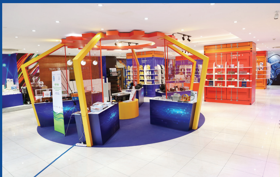
Tuần lễ kết nối giao thương và giới thiệu sản phẩm ngành cơ khí, công nghệ số, điện và điện tử năm 2024

Liên hệ: Phòng dịch vụ - ITPC Điện thoại: (028) 39104903 (028) 39104039 (028) 38222 983 (028) 39104947 Email: bizcenter@itpc.gov.vn; Website: www.itpc.hochiminhcity.gov.vn vexa.vn