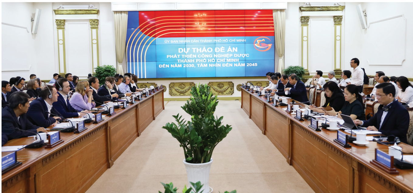
Hội nghị gặp gỡ giữa Lãnh đạo Thành phố Hồ Chí Minh và Hiệp hội Thương mại Mỹ tại Việt Nam chủ đề "Hợp tác thúc đẩy y tế tại Thành phố Hồ Chí Minh" do ITPC xúc tiến tổ chức tháng 3/2024.

thời, cần thiết xác định các nhóm ngành có tính chất tương hỗ, tác động qua lại để có định hướng phát triển phù hợp cho từng hệ sinh thái ngành dịch vụ của TP.HCM.