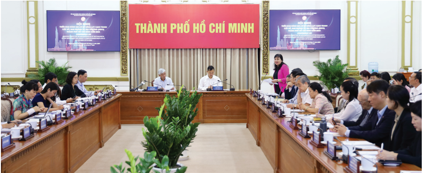
Trong ảnh là Hội nghị công bố triển khai DDCI năm 2023. Năm nay ITPC tiếp tục được giao chủ trì phối hợp với các cơ quan tổ chức hiệu quả Kế hoạch khảo sát, đánh giá năng lực cạnh tranh cấp sở, ban ngành và địa phương (DDCI).