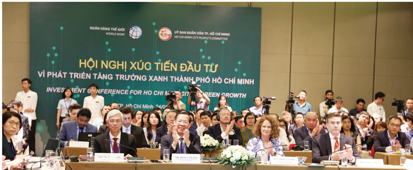
Trong ảnh là Hội nghị “Kêu gọi đầu tư vì phát triển tăng trưởng xanh Thành phố Hồ Chí Minh” do ITPC tham gia tổ chức tháng 1/2024. Đây là hoạt động phù hợp với định hướng phát triển các ngành dịch vụ cao cấp, hiện đại, có giá trị gia tăng cao của TP.HCM.

NGÀY 9/8/2024, UBND TP.HCM ĐÃ BAN HÀNH QUYẾT ĐỊNH SỐ 3107/QĐ-UBND VỀ PHÊ DUYỆT ĐỀ CƯƠNG ĐỀ ÁN “XÂY DỰNG THÀNH PHỐ TRỞ THÀNH TRUNG TÂM DỊCH VỤ LỚN CỦA CẢ NƯỚC VÀ KHU VỰC VỚI CÁC NGÀNH DỊCH VỤ CAO CẤP, HIỆN ĐẠI, CÓ GIÁ TRỊ GIA TĂNG CAO”. BẢN TIN ITPC TRÍCH DẪN MỘT SỐ NỘI DUNG QUAN TRỌNG CỦA KẾ HOẠCH NÀY.