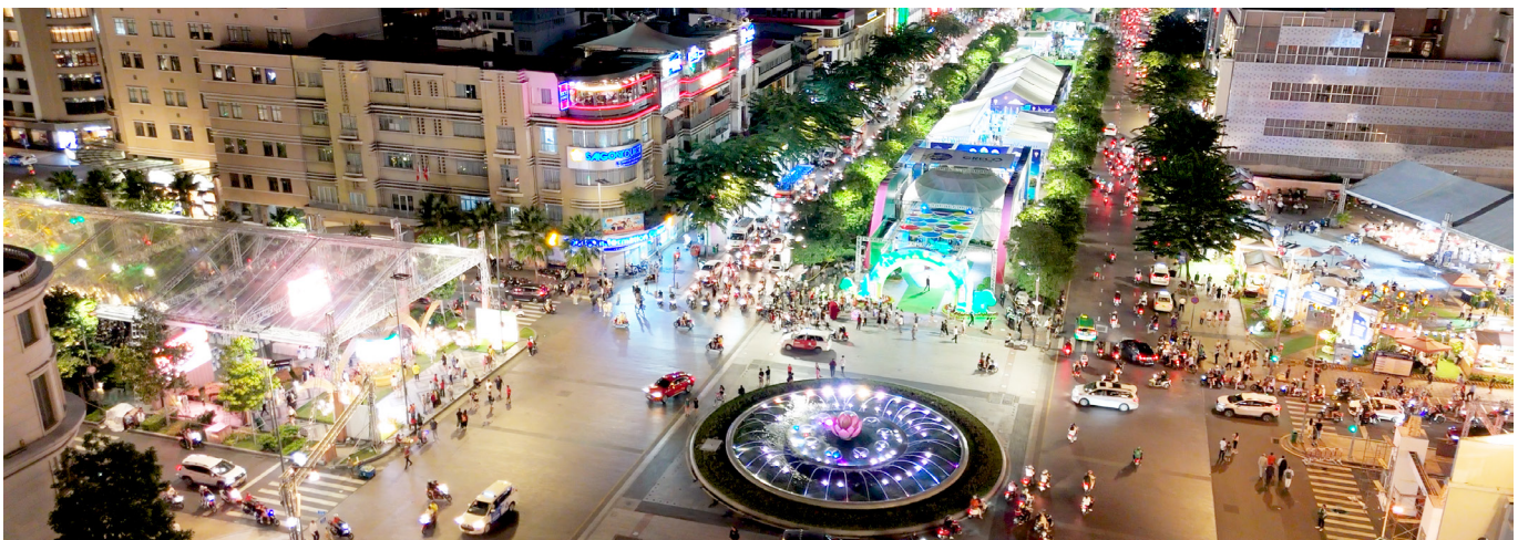
Phòng Xúc tiến Thương mại - ITPC

Trung tâm Xúc tiến Thương mại và Đầu tư Thành phố Hồ Chí Minh (ITPC) trân trọng thông báo và rất mong nhận được sự quan tâm tham gia của Quý đơn vị. Thông tin đăng ký xin vui lòng gửi về trước ngày 06/9/2024 .