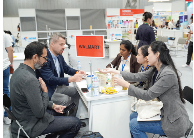
Các ảnh trên trang bìa là những hoạt động thúc đẩy xuất khẩu diễn ra tại “Diễn đàn xuất khẩu 2024” do ITPC phối hợp tổ chức tháng 6/2024 tại TP.HCM.